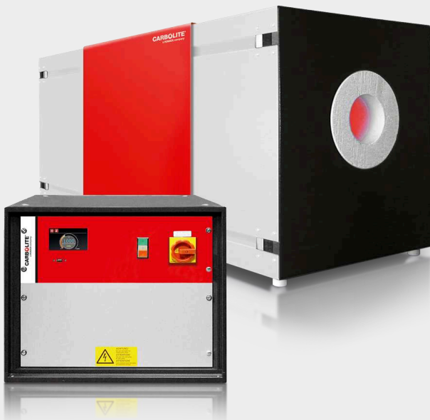
OFENKÖRPER UND SEPARATE STEUEREINHEIT