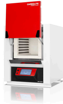
CWF 13/36 with AriesPlus temperature controller