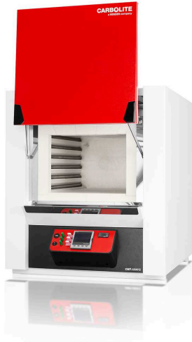
CWF 13/65 with nanodac temperature controller