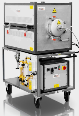
GLO 10 / 11-1G: Forno compatto a pareti calde con storta in acciaio inossidabile e storta in inconel opzionale (vuoto fino a 750 ° C e sotto pressione normale fino a 1100 ° C)