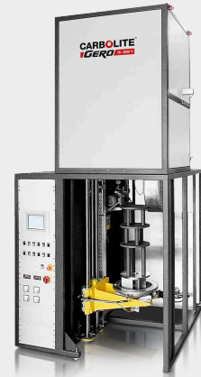
VGLO - versione del forno GLO configurata verticalmente