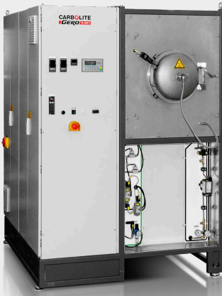
GLO 40 / 11-1G semiautomatico fino a 1100 ° C