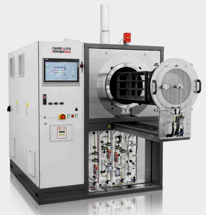
Piec GLO 120/11-1G automatyczny do 1100°C z opcjonalnym wyposażeniem do pracy z wodorem oraz drzwiami szufladowymi