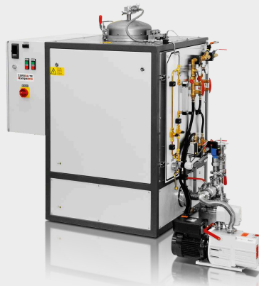
Piec VGLO z załadunkiem od góry 10/11-1G, manualny do 1100°C z opcjonalną pompą próżniową (750°C max.)