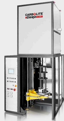
VGLO - pionowa wersja pieca GLO