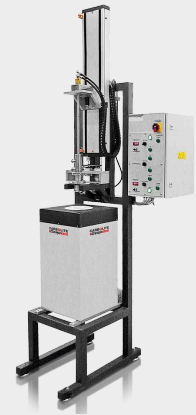
Standardowy piec do hodowli kryształów metodą Brigmana do 1800°C