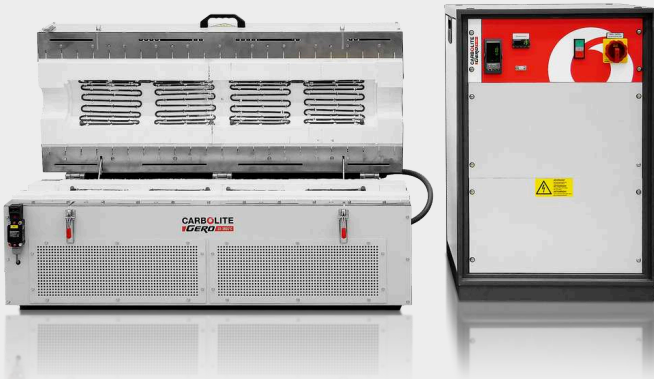
FURNACE BODY AND SEPARATE CONTROL BOX