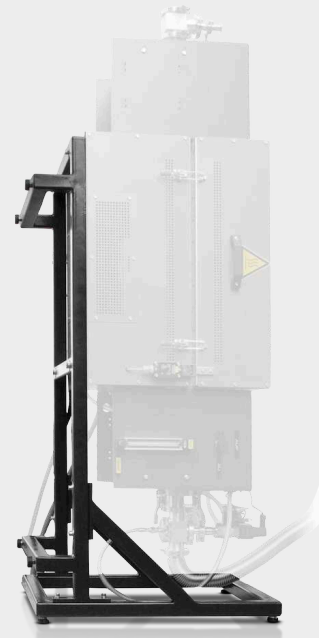
OPTIE: VERTICALE STATIEF