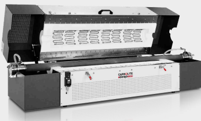
FZS 13/100/1000 met metalen APM buis