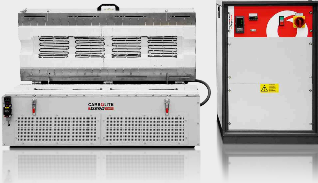
OVENGEDEELTE EN AFZONDERLIJKE SCHAKELKAST