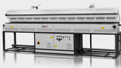
Op maat ontworpen 3-zone FZS 13/100/4500 met 4500 mm verwarming lengte, geautomatiseerde opening en APM werkbuis